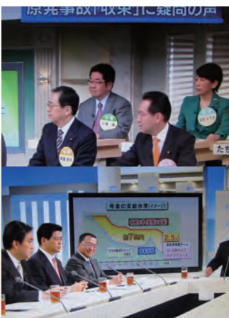
上/12月17日TBS「サタデーずばっと」 下/12月4日NHK「日曜討論」